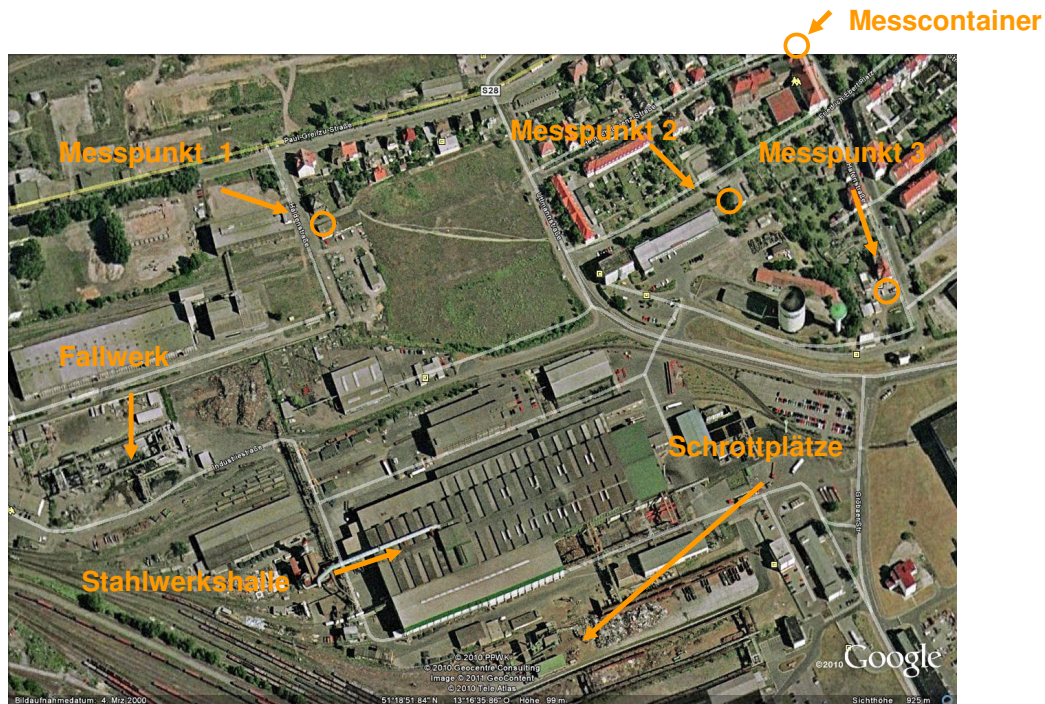
Abb. 1 Messpunkte der Messungen der LfULG (2008-2009)

Die Messergebnisse des LfULG aus der Messkampagne 2008/2009 wurden nach Erweiterung des Stahlwerkes ermittelt. Aufgrund der Wirtschaftskrise 2008/2009 erzeugte das Stahlwerk in dieser Zeit nicht die volle Kapazität von 1 Mio. t Stahl, sondern deutlich weniger.