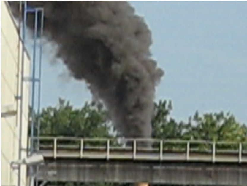
Abb. 5 Abgase am Schornstein eines Schredders nach einer Verpuffung

Von wesentlicher Bedeutung ist, dass nach einer Verpuffung die Anlage auf eventuelle Undichtigkeiten sorgfältig überprüft und der Schreddervorgang erst dann fortgesetzt wird, wenn sich die Anlage wieder in einem voll funktionsfähigen Zustand befindet. Wie das Beispiel einer eingehausten Anlage in Hessen zeigt, ist dies häufig nicht der Fall. Die Folge sind erhebliche diffuse Emissionen im Regelbetrieb.