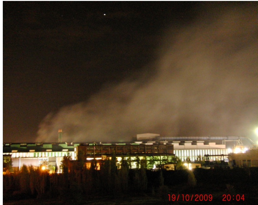
Abb. 2 Staubemissionen, die durch die Dachluken im Stahlwerk Riesa freigesetzt werden

Aufgrund dieser Messergebnisse besteht daher dringender Handlungsbedarf zur Reduzierung der hohen Belastungen durch Dioxine und PCB im Umfeld des Stahlwerkes.