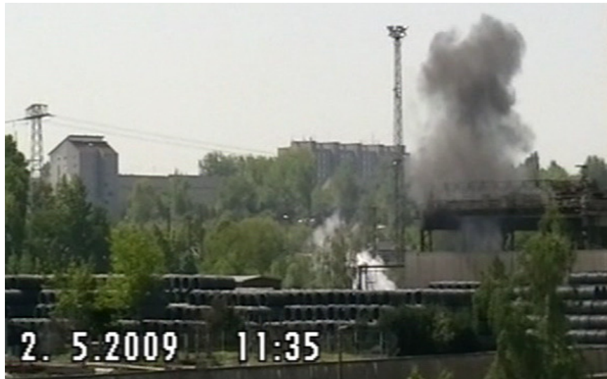
Abb. 4 Staubpilz, der beim Entladen von Schlacke im Fallwerk entsteht