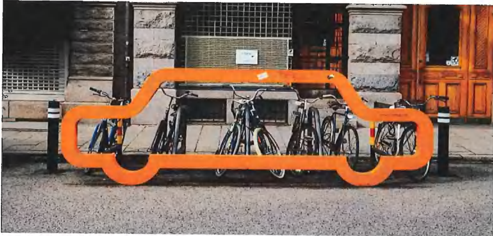
Bürgerantrag Geestemünder 12 von 14