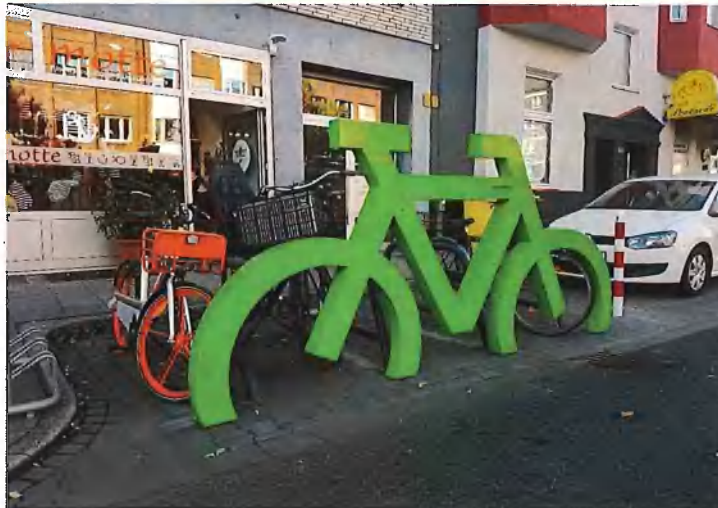
Bürgerantrag Geestemünder 10 von 14