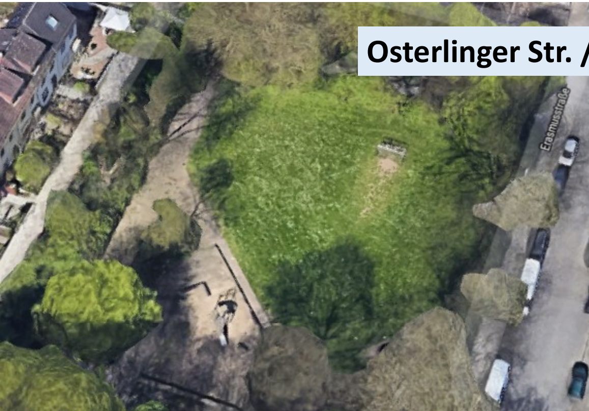
Osterlinger Str. / Eramusstr.