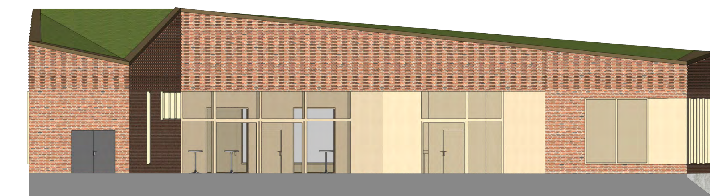
Ansicht Schlachthof Maßstab 1:100