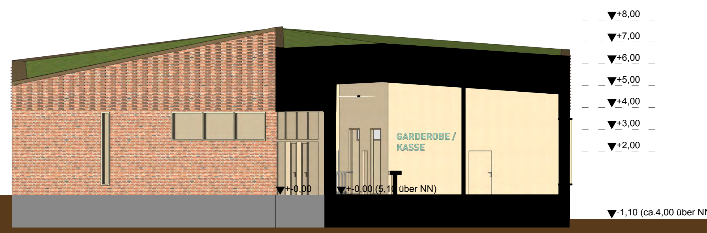
Schnitt B-B Maßstab 1:100