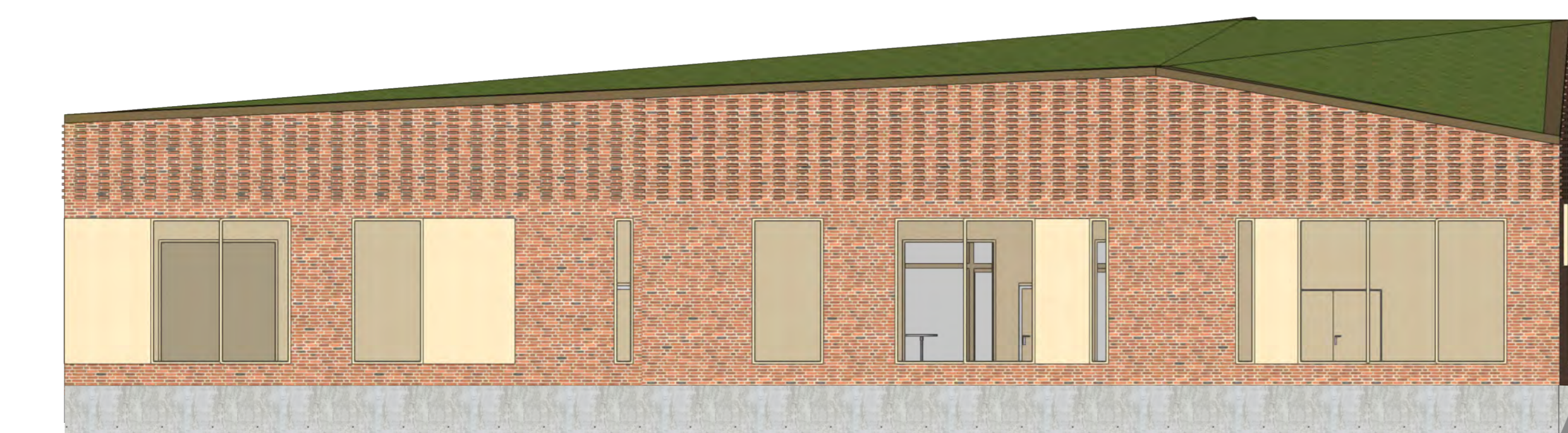
Ansicht Bürgerweide Maßstab 1:100