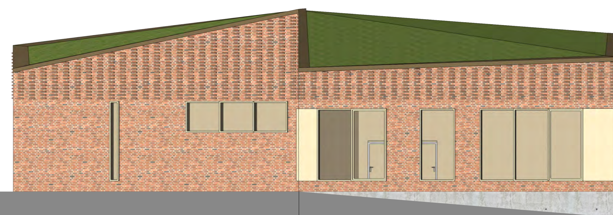
Ansicht Grünwall Maßstab 1:100