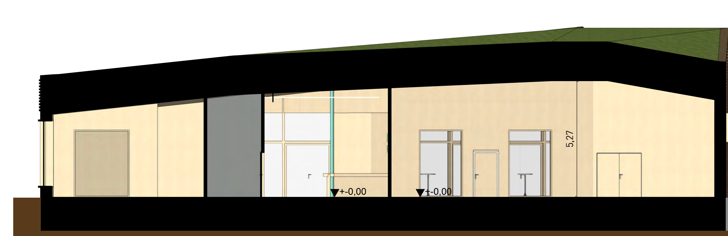
Schnitt A-A Maßstab 1:100