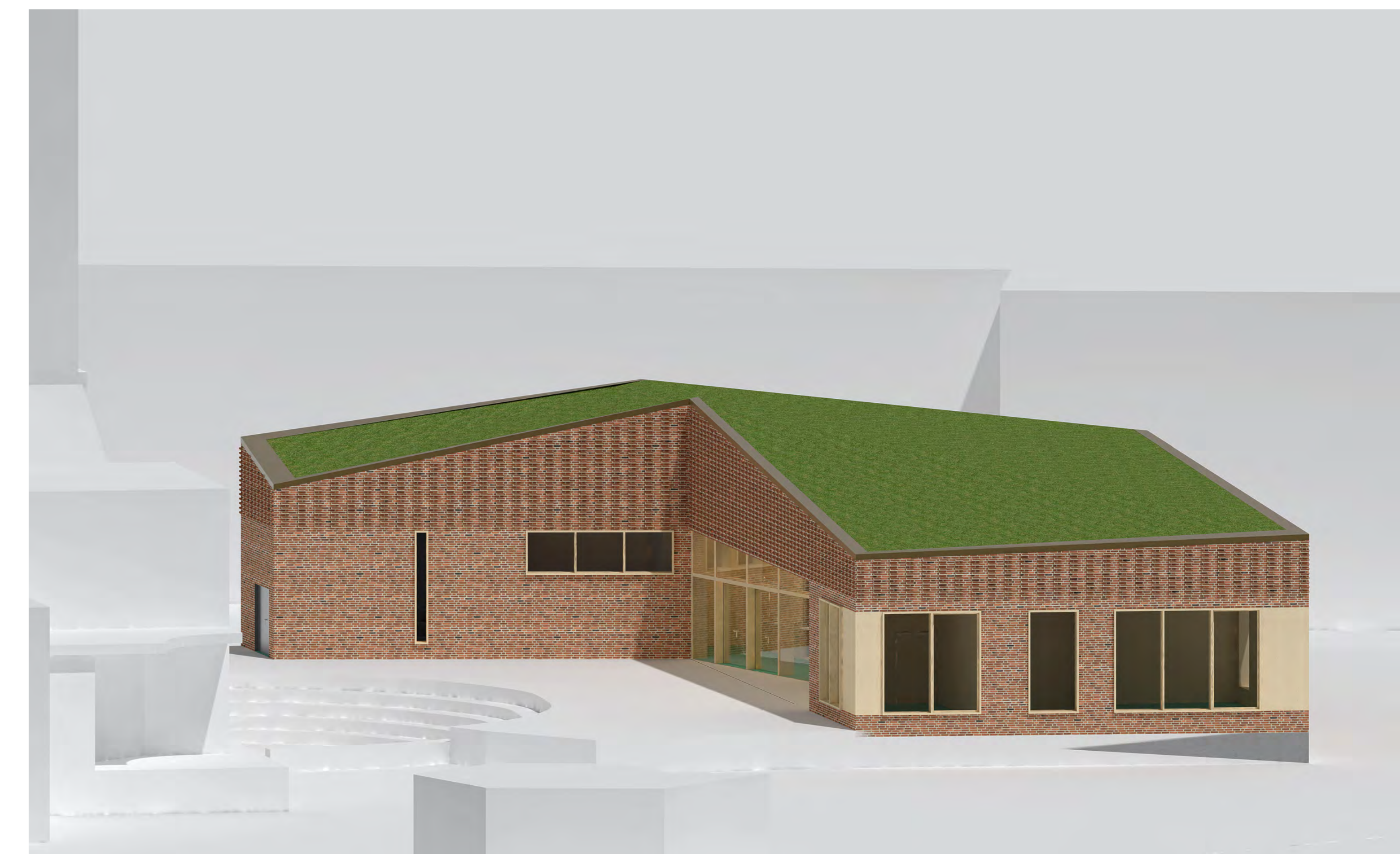
Visualisierung Blickrichtung - Messehalle 7