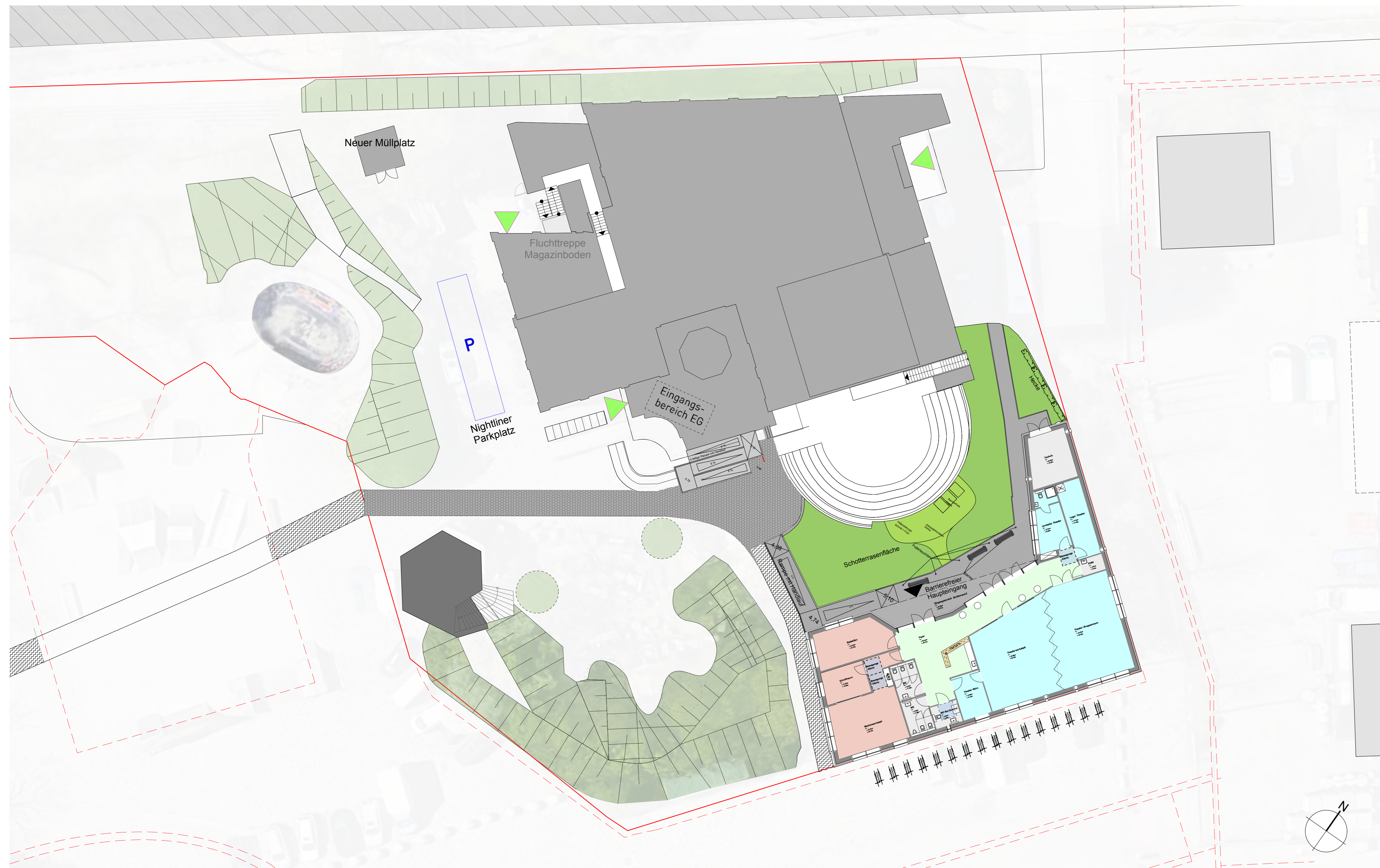
Lageplan Maßstab 1:200