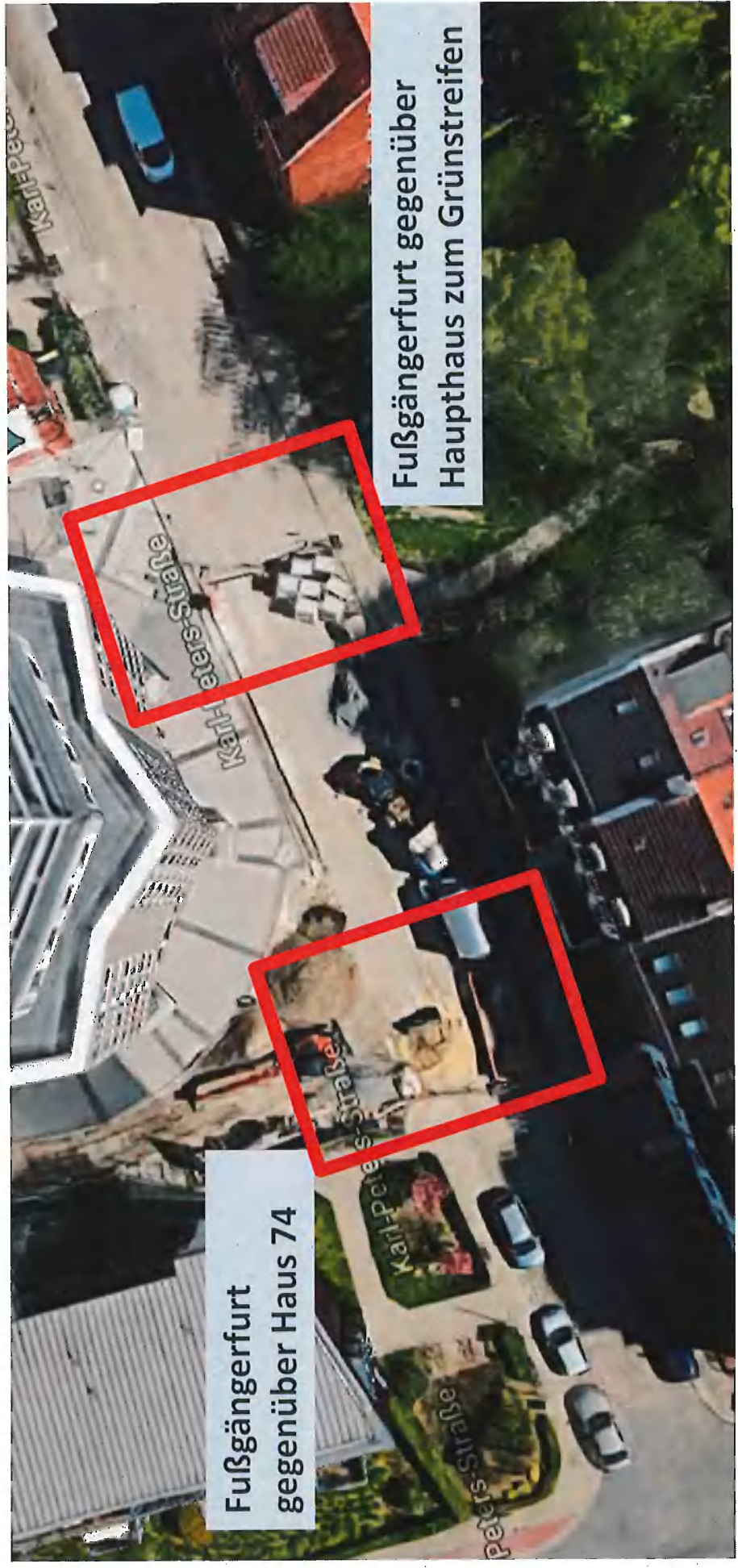
Fußgängerfurt gegenüber Haus 74